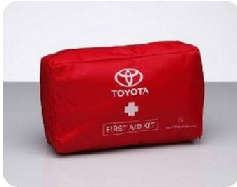
Erste Hilfe Tasche